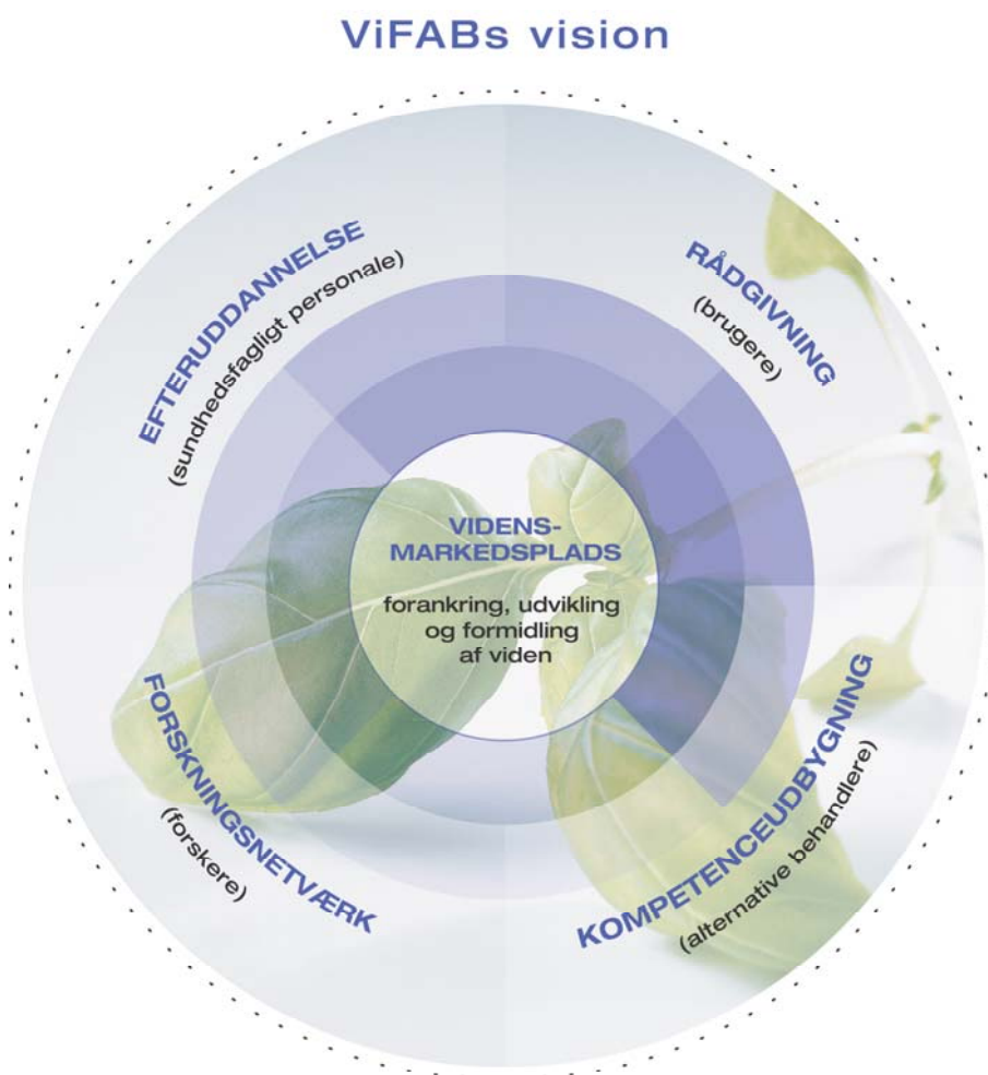
Figur 1: ViFABs vision

ViFABs vision er illustreret ved figur 2: